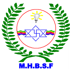
La Seconde conception du Logo