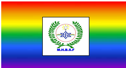
Le drapeau Arc en ciel en cours de conception