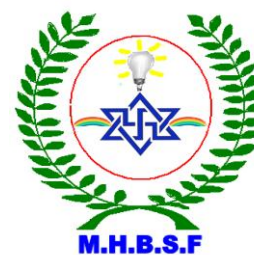
Et enfin la dernière

La devise de la Communauté du Mouvement Humanitaire des Bâtisseurs Sans Frontières est : En avant pour une civilisation planétaire paradisiaque de l'âge d'or.