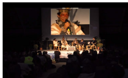
NATURERIGHTS / CONFERENCE AVEC BENKI PIYAKO, J. BOVÉ, P. RABHI - LYON