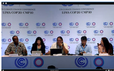
GLOBAL ALLIANCE / CONFERENCE DE PRESSE / LIMA COP20