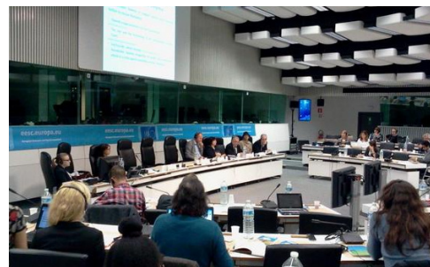
END ECOCIDE / COMMISSION EUROPÉENNE BRUXELLES