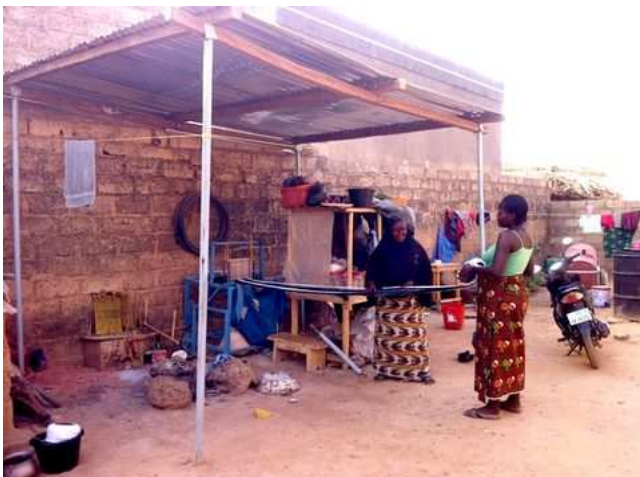
Wakogldo : la ŝirmejo

Wakogldo en Rimkeita , gea grupo, situanta en la 14a sektoro de Vagaduguo (aktiveco : teksado de tradiciaj vestoj). Ekde decembro, la teksistoj fabrikis 38 robojn kaj ili sukcesis vendi 25 el ili. Unu membro ricevis klerigon kaj unu metilernantino nun ricevas klerigon.